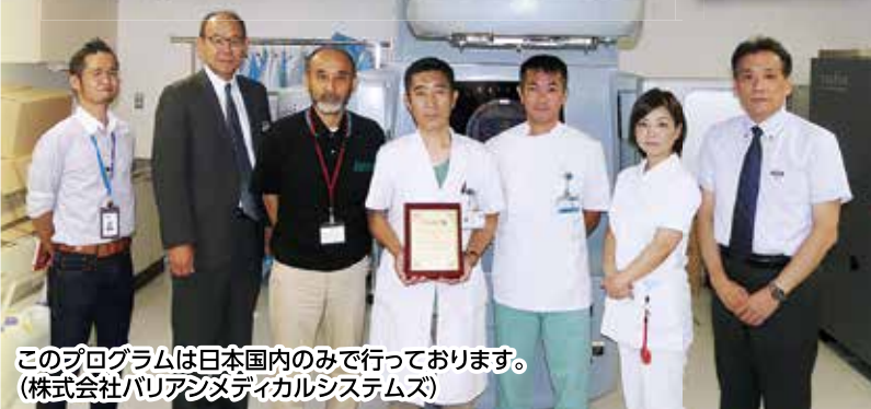
このプログラムは日本国内のみで行っております。 (株式会社パリアンシメディカルシステムズ)