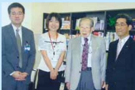
2011/4/29NPO医療の質に関する研究会名誉理事長 日野原重明(聖路加国際病院名誉理事長)右から2番目

日野原重明先生にも、ご来訪頂きました。1F「患者図書室健康への架け橋」が皆様に支えられてオープンして6年になりました。