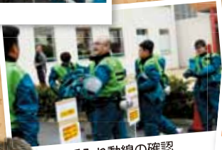
受入れ動線の確認