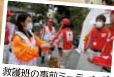
救護班の事前ミーティング