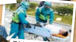
ストレッチャー搬送