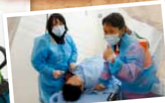
除染後のトリアージ