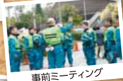
事前ミーティング