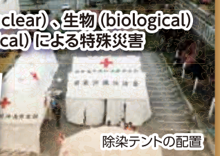
除染テントの配置