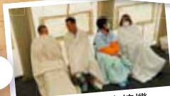
除染後の診察待機