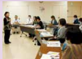
短期講習(ロコモ予防)検討会