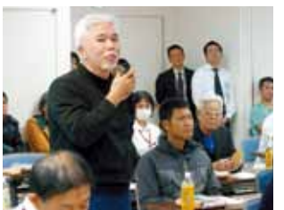
フロアーから医療法人格仁会整形外科よせクリニックの理事格理事