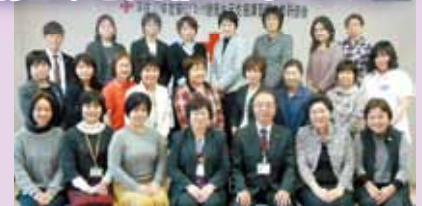
九州担当者、職員・ボランティア指導員全員で