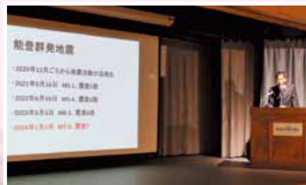
講演『能登半島地震における沖縄赤十字病院の活動』 救急・集中治療部医師 金城雄生