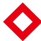
レッドクリスタル