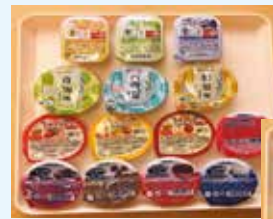
当院で取り扱っている 栄養補助食品の一例

管理栄養士がベッドサイドへ伺い、食事摂取量アップに向けて患者様に適した硬さ、量、味付けをご提案させて頂いています。また、栄養補助食品を活用する事もあります。栄養補助食品は食欲がなくても口にしやすい、エネルギーやたんぱく質、微量栄養素などをまとめてとる事が出来ます。飲み物やゼリー等の種類があり、患者様の好みや希望に合わせて提供しています。