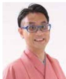
北山亭メンソーレ