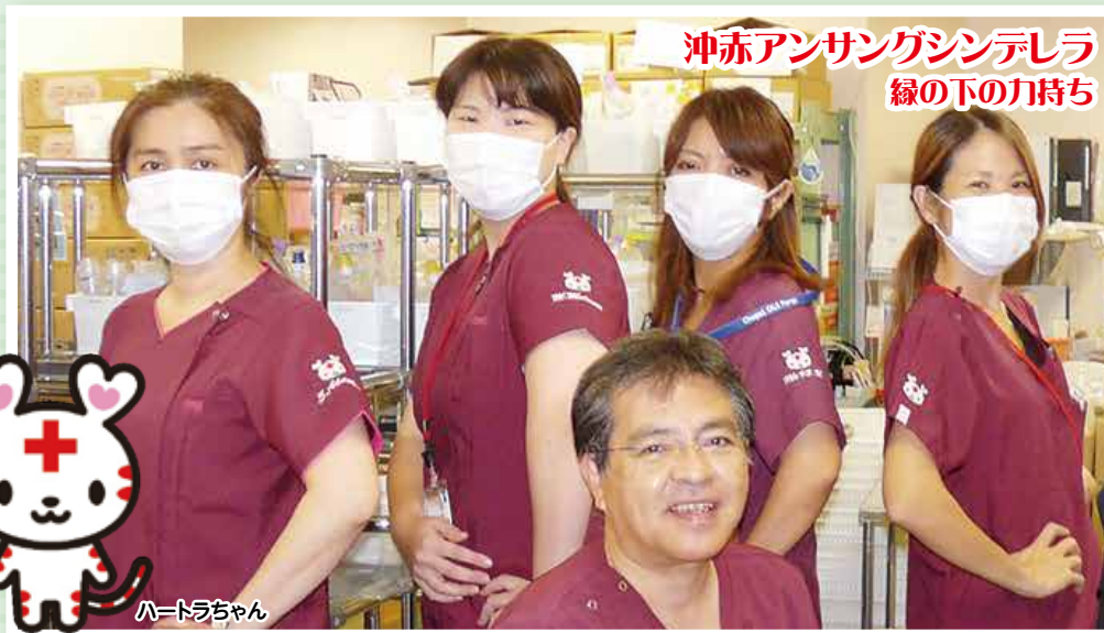
沖赤アンサンブルシンデレラ 緑の下の力持ち