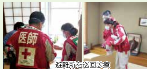
避難所を巡回診療