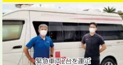
緊急車両2台を運ぶ