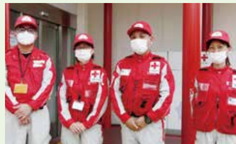
7/9出発式には後発の4人が参加しました

医療救護班6人が熊本県人吉市に派遣され7/11~14救護活動に携わりました。緊急車両を運ぶため救護班2人が7/9早朝先発し、他の救護班4人は7/10出発しました。7/9出発式を行いました。さらに第2班を7/19~7/24派遣し7/17出発式を行いました。