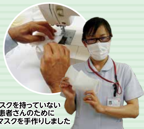
マスクを持っていない 患者さんのために 簡易マスクを手作りしました