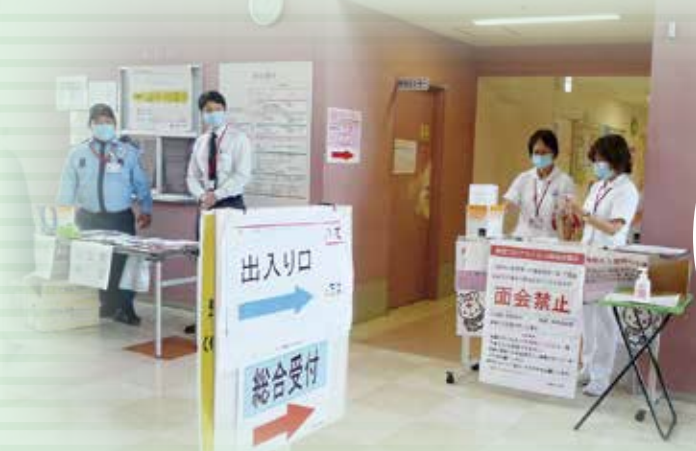
笑顔で頑張っている 最前線の看護師

今「新型コロナウイルス」という敵と全世界の人々は戦っています!最前線の医療現場で私達もウイルス根絶のため頑張っています。当院は4月4日からゲートコントロールを開始しました。