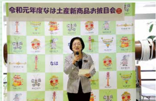
城間幹子那覇市長が3月11日にバッジを着用してくださいました。