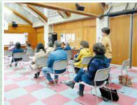
熱心に質問する受講者